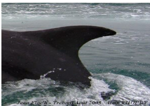
Jean Floc'h - Tréboul Août 2005 / Alain KHOURY