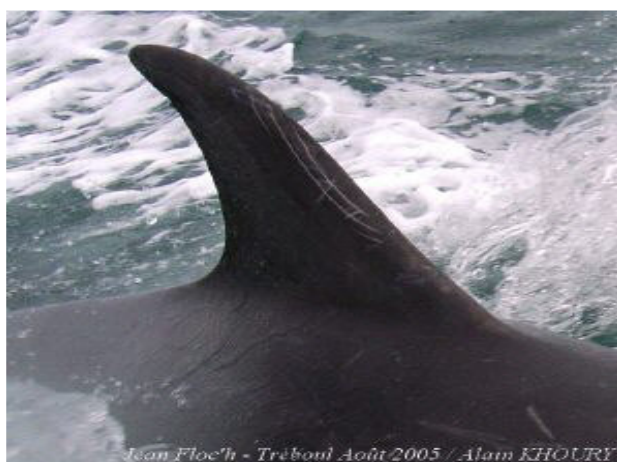
Jean Floc'h - Tréboul Août 2005

Photos ci-dessus prises l'été 2005