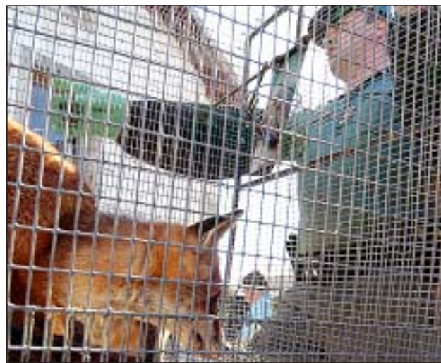
● Les autorités ont procédé hier à la saisie d'une centaine de bêtes dont des renards roux.

Que l'éleveur se console. Mis en garde à vue mardi soir, il devait être libéré hier soir et retrouver ses quelque 150 animaux domestiques – fouines, chats, chiens moutons, oies, poules – pas concernés par la procédure.