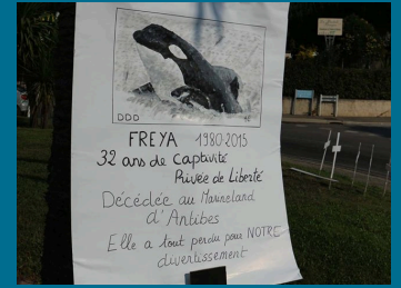
29 juillet 2015 - Photos : Eric Mogwai