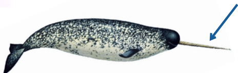
D E F E N S E

D J P C B D O R S A L E A S E U B T P M X C T Q O P F D Q T V C U S I H N M C X S E L L E Q I R T V W A P K L N F G T L A Q R T L U R I O C D G L Y H B Z L R O S E A T S O P N G F O G S W F U P M N K G R E S F T A A O G H S D C V K I C R P J Y T R C S J K N T N E F D E F E N S E A L E I O R T Q E A V G H T K S