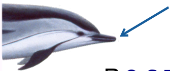
R O S T R E