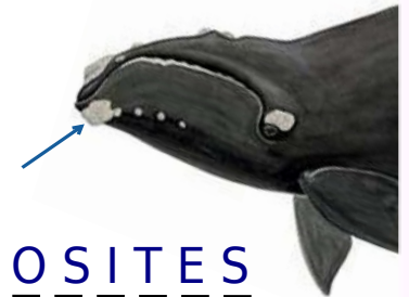
C A L L O S I T E S

D J P C B D O R S A L E A S E U B T P M X C T Q O P F D Q T V C U S I H N M C X S E L L E Q I R T V W A P K L N F G T L A Q R T L U R I O C D G L Y H B Z L R O S E A T S O P N G F O G S W F U P M N K G R E S F T A A O G H S D C V K I C R P J Y T R C S J K N T N E F D E F E N S E A L E I O R T Q E A V G H T K S