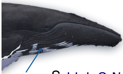
S I L L O N S

Activité → Découvre les 6 mots illustrés ici et retrouve-les dans la grille. Ils sont cachés verticalement et horizontalement.