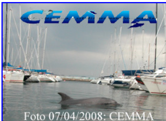
Jean-Floc'h en Galice – avril 2008

Voir : http://www.blogoteca.com/cemma - Il s'agit du blog du CEMMA, régulièrement mis à jour.