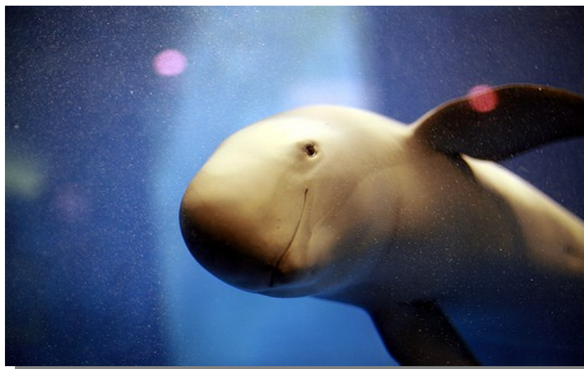
Annexe 1: Détail des marsouins aptères captifs par établissement et par région en 2009 (Légende: M: Mâle; F: Femelle; NC: Né en captivité; S: Capturé à l'état sauvage)