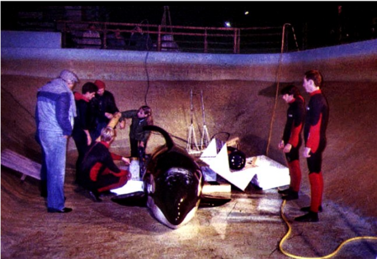
Cétacés morts en captivité